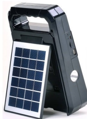
軽量約768g（乾電池含まず）