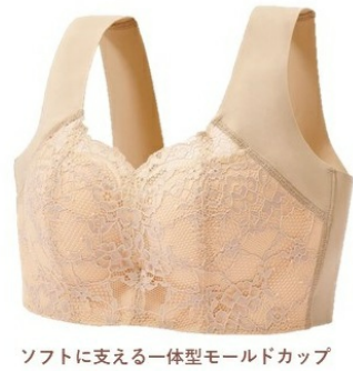
ソフトに支える一体型モールドカップ