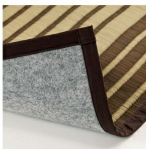
床を傷つけにくい 不織布貼り