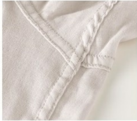
④肌に縫い目があたらぬ仕様