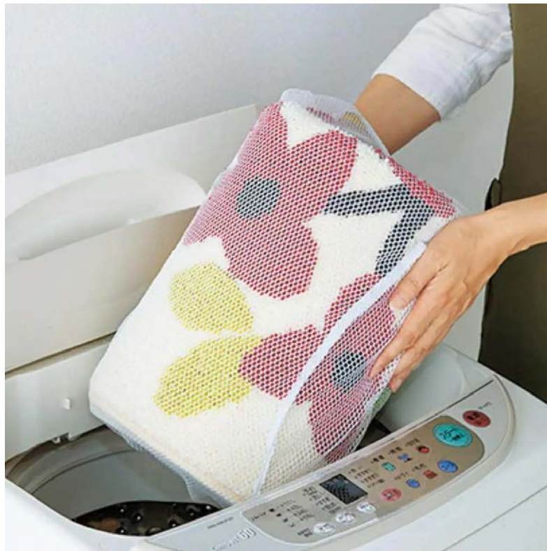
洗濯機で丸洗いできます。(I (ネコフラワー))