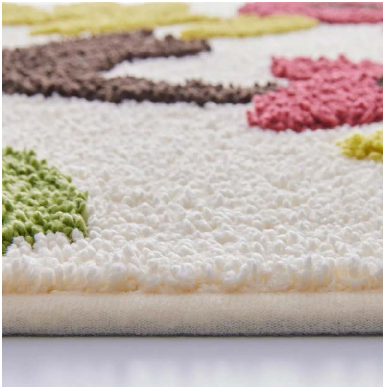
厚み約19mmでふかふかな踏み心地 (I (ネコフラワー))