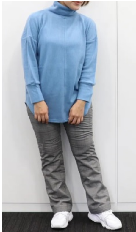
ブルー コーディネート例 (スタッフ身長152cm、Mサイズ着用) ※パンツは品番MP-1606