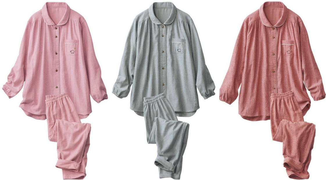
(左から パウダーピンク、グレー、カーディナルレッド)