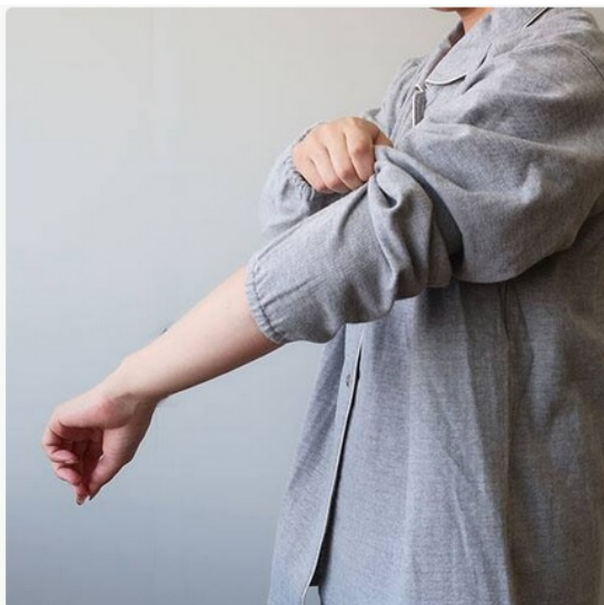
1.第一ボタンを外しても開きすぎない第二ボタン位置 2.袖口ゴム仕様で冷気を通しにくく、家事の時も快適