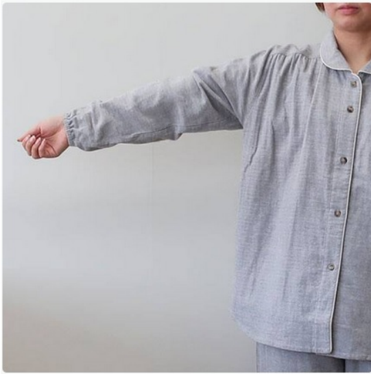
寝返りもスムーズなゆったり設計