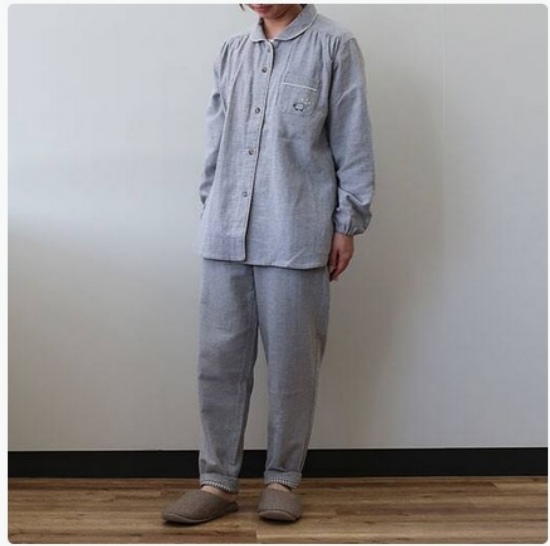
ゆったり寸法で全身リラックス