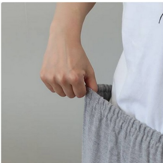
3.お尻まわりを包み込む、少し長めの後ろ裾まわり 4.細いゴムを2本通すことで締め付け感を軽減。お腹に優しくフィット