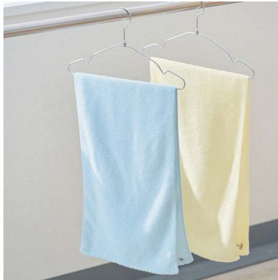
【今治産】空気のようなタオルハンカチ（同色2枚組） https://www.cecile.co.jp/c/pr02/ 1,790円（税込）