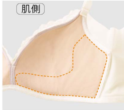
内蔵内寄せパネル