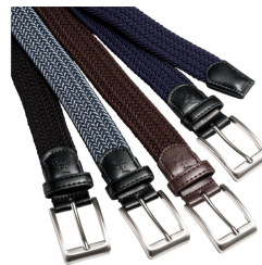
ストレッチメッシュベルト (CUPC) 2,200 円 (税込)~