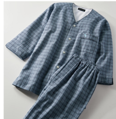
衿無パジャマ・ GEORGEKENT(8分袖) 3,290 円 (税込)