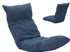
包み込まれるようなウェブチェア /3か所リクライニング (頭部・背部・脚部) 14,900 円 (税込)