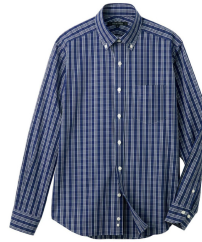
日本製・綿 100% こだわりデザインシャツ 6,900 円 (税込)