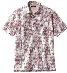
抗菌・防臭・総柄プリント ポロシャツ (UP レノマ) 4,390 円 (税込)