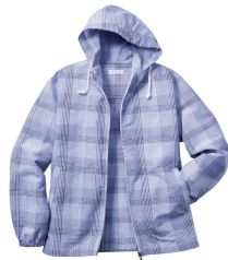
サッカー素材シャツパーカ 3,300 円 (税込)