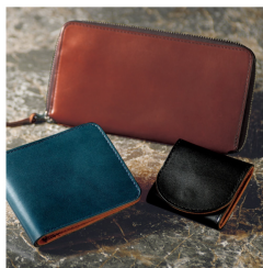
風合いある革の 日本製栃木レザー財布 4,400 円 (税込)~